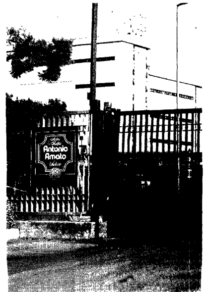
Il pastificio Giorni di intenso lavoro in vista del Natale